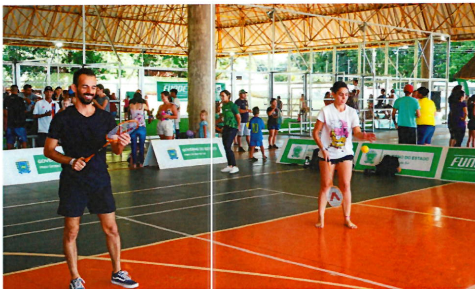
Surdos aprenderam técnicas do Badminton no 1º Festival Surdolímpico