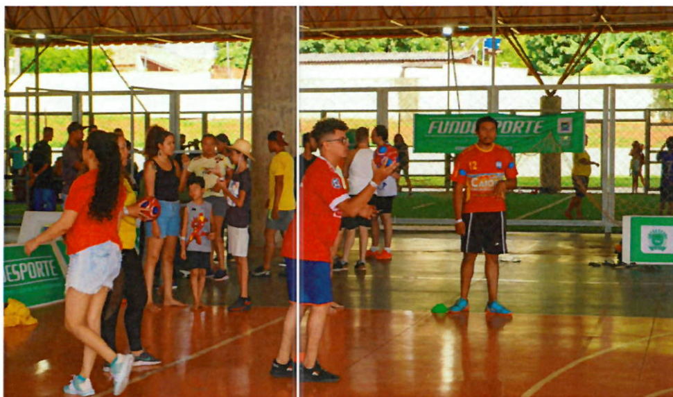
Handebol foi uma das modalidades que fizeram parte do programa do 1º Festival Surdolímpico 2023