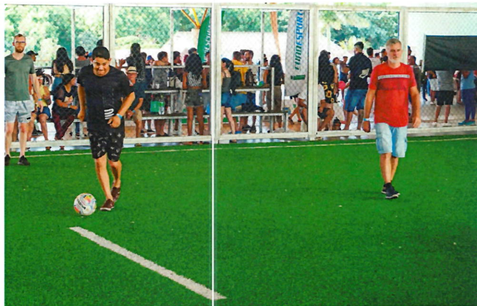
Surdos participam das atividades de Futebol Society.