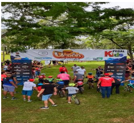
FIRE BIKE KIDS