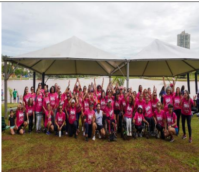
MOVIMENTO ALUSIVO DAS MULHERES