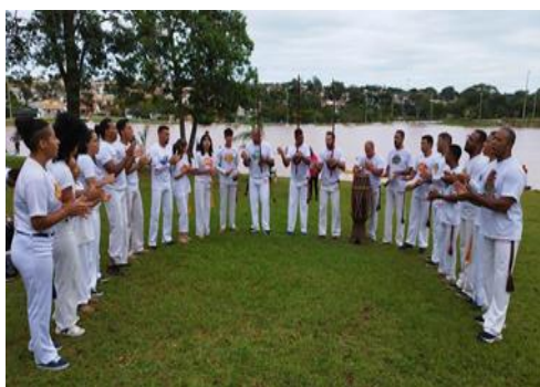
OFICINA DE CAPOEIRA