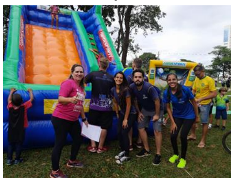
OFICINA DE BRINQUEDOS