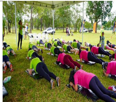
OFICINA DE IOGA