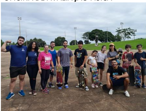
OFICINA DE SKATE