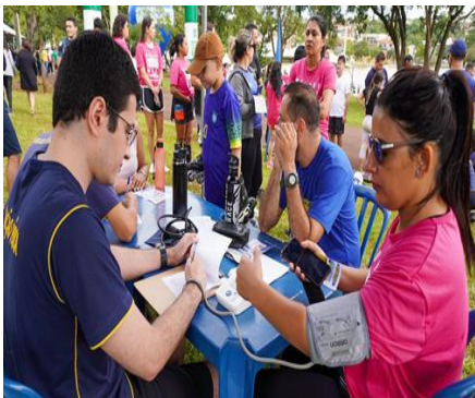
OFICINA DE AVALIAÇÃO FÍSICA