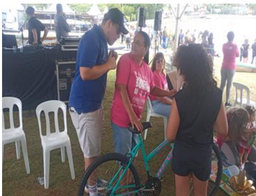
SORTEIO DA BICICLETA