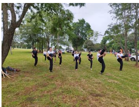
OFICINA DE KUNG FÚ